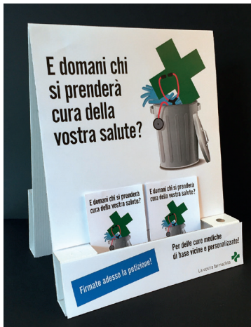
1x espositore A4+

Raccogliete firme per il futuro di noi tutti!