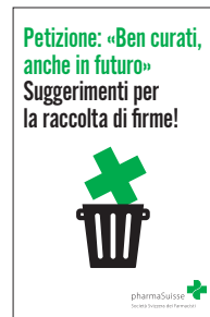
Per i team di farmacia: 10x istruzioni per la petizione, 80x120mm