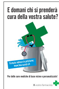
50x volantini 80x120mm